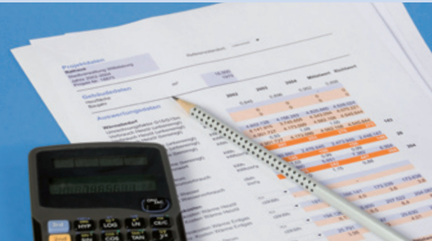
Ermittlung von Energiekennzahlen

Wie lässt sich kommunale Energiearbeit optimieren und erfolgreich umsetzen? Antworten auf diese komplexe Frage und Lösungen bietet Ihnen der European Energy Award®.